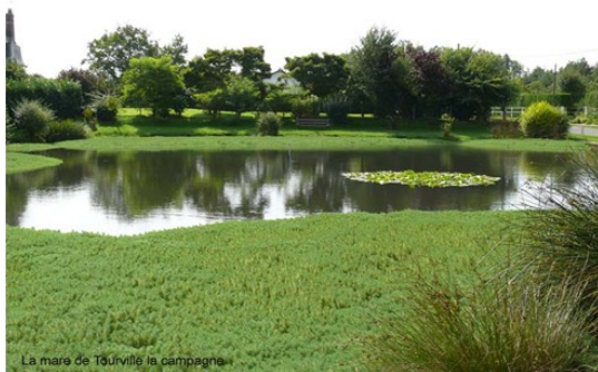
La mare de Tourville la campagne