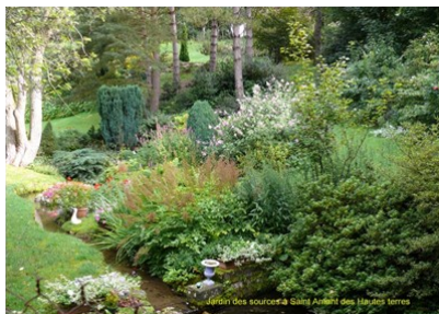
Jardin des sources à Saint Amant des Hautes terres

6 - Passer le carrefour et à la première intersection tourner à droite sur la D.593 direction St Aubin des frènes. 7) Couper la D.85 et prendre la rue du Prieuré et tourner à gauche dans un chemin de terre en direction du Clos Hue sur la carte, et rejoindre Tourville par la rue Madeleine Fosse et le point de départ.