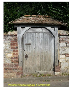
Porche Neubourgeois à Amfreville