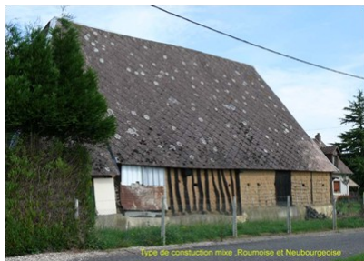
type de construction mixte :Roumoise et Neubourgeoise